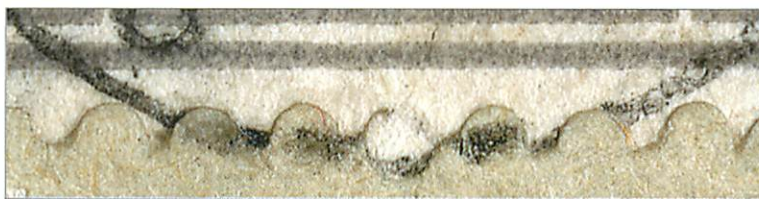
Vergrösserung (mit 1200 dpi gescannt) / Agrandissement (scanné à 1200 dpi)

Maintenant, les choses deviennent plus claires; vous pouvez voir sur l'agrandissement que le cercle du timbre a été dessiné sur la lettre (l'encre du timbre n'est pas identique et il y a des irrégularités dans le cercle).