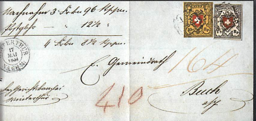
Kostbarkeiten aus der 70. Rölli Auktion