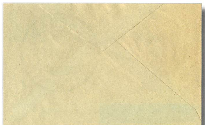
Vorderseite / recto

Tout d'abord, laissez-moi vous présenter le corpus delicti :