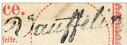
Cachet du groupe 49

Le cachet de transit est un cachet test de Güller (cachet à double cercle avec un pont et une croix encadrée en bas, le tout en écriture elzévir).