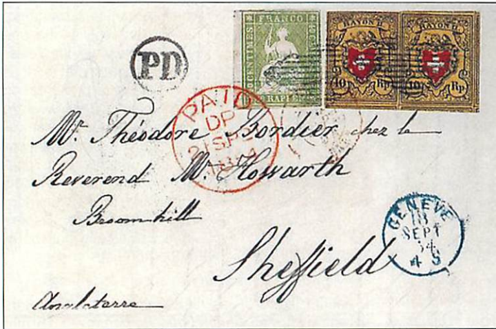
Lettre de Genève pour Sheffield affranchie à 60 centimes (Z 26Aa et une paire de Rayon II).

Il existe des affranchissements Helvetia assise avec «chiffre et croix», Helvetia assise avec Helvetia debout et Helvetia assise avec «chiffre et croix» et Helvetia debout. «Le plus c'est mélangé, le plus c'est fou et surtout le plus c'est rare!» pourrait-on dire! Ces affranchissements mixtes étaient