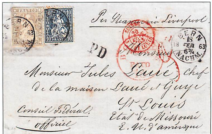
Lettre de Berne pour St-Louis (Missouri, Etats-Unis) affranchie à 1.10 francs. Lettre écrite par Constant Fornerod, ancien président du Conseil fédéral, responsable à cette époque du Département de l'extérieur. (27C [27B2sz] et 31).

avec les Helvetia assises non dentelées. L'utilisation des timbres cantonaux, des timbres de la période de transition, des timbres fédéraux et de tous les Rayons s'étend jusqu'au 30 septembre