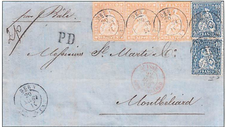
Lettre de Berne pour Montbéliard (France) affranchie à 80 cts (2ème échelon de poids [7½ à 15g]; tarif du 15.8.1859 au 30.9.1865.

Toutes les émissions qui ont eu cours avant le 31.XII.1924 sont théoriquement concernées, les fils de Tell (les deux dessins différents), les Helvetia (les deux dessins différents), les bustes de Tell, les Helvetia avec épée, les émissions avec valeurs surchargées, la série pour la Paix, les écussons et les 50 ans de l'UPU. N'oublions pas la série UPU 1900 dont la validité est extrêmement restreinte du 2.VII.1900 au 31.XII 1900. Avec ces timbres, il y a aussi des affranchissements mixtes recherchés avec l'Helvetia debout et «chiffre et croix».