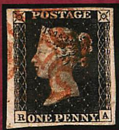
Penny Black 180 ans