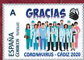
Covid-19 et philatélie