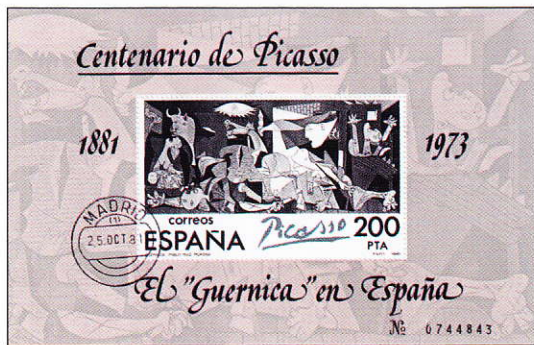
Bloc commémoratif pour le centième anniversaire de Picasso (Mi bloc 231)

Ce bloc (bloc numéroté émis en 4'633'181 exemplaires) est aussi imposant que la peinture originale mesurant 163x115mm, le timbre seul s'impose avec 83x50mm.