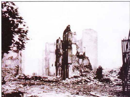
Guernica après le bombardement - Fonds des archives fédérales (Allemagne).

Afin de créer un lien entre la philatélie et l'art, nous vous présentons ce bloc commémoratif pour le centième anniversaire de Pablo Ruiz Picasso qui fut émis le 25 octobre 1981. Il existe deux types de blocs, l'un avec le numéro de contrôle en écriture grotesque et l'autre en écriture antiqua.