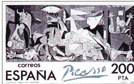
Le timbre isolé du bloc (Mi 2520)

de la ville de Guernica qui eut lieu le 26 avril 1937, lors de la guerre d'Espagne (de juillet 1936 à avril 1939), et qui devint rapidement un symbole de la violence de la répression franquiste avant de se convertir en symbole de l'horreur de la guerre en général. Elle est exposée au musée de la Reine Sofia à Madrid.