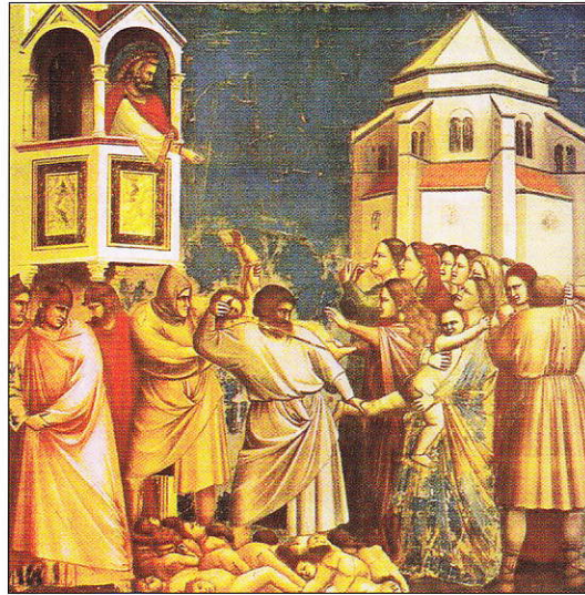
Massacre des Innocents, fresque de Giotto di Bondone, Chapelle Scrovegni de Padoue

«La guerre d'Espagne est la bataille de la réaction contre le peuple, contre la liberté. Toute ma vie d'artiste n'a été qu'une lutte continue contre la réaction et la mort de l'art. Dans le panneau auquel je travaille et que j'appellerai Guernica et dans toutes mes œuvres récentes, j'exprime clairement mon horreur de la caste militaire qui a fait sombrer l'Espagne dans un océan de douleur et de mort». Picasso