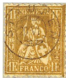
SBK 52 – Fälschung