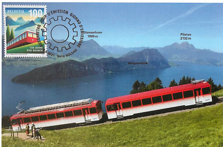
T. émis le 6.5.2021 Obl. sp. ill. P.J. à Goldau