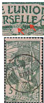
77A.3.02 Case 160