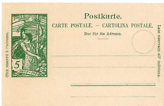
PK 032.P07 selon Baer

Le tirage des entiers postaux s'élève à 7'400'000 exemplaires et leur validité s'étend du 2 juillet 1900 au 31 décembre