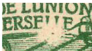
Agrandissement du défaut principal