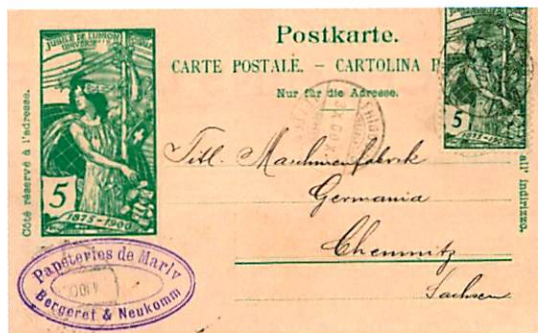
L'entier postal à gauche avec affranchissement complémentaire SBK 77A pour l'envoi à Eschwege en Allemagne. L'entier postal à droite avec l'affranchissement SBK 77B pour l'envoi à Chemnitz en Allemagne.