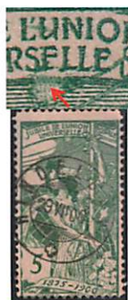
77A.3.01 Case 110