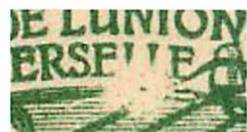
Illustrations 1, 2 et 3