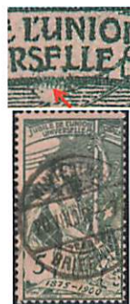
77A.3.01 Case 10