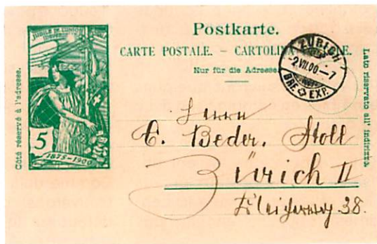
Deux exemples oblitérés du premier jour, soit du 2 juillet 1900.