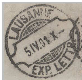
Lame de rasoir 7.01 DR: 1

Lettre de Lausanne pour Paris affranchie à 1franc (71Dd) oblitérée par une lame de rasoir (7.01; DR: 1).