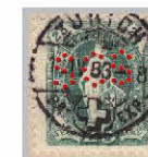
Perfin S31 (scs), Société Crédit Suisse, Zurich, utilisé de 1874 à 1893)

«Tit: Erlaube mir hiermit einige Zeilen an Sie zu richten. Da mir vor einiger Zeit ein Packet verloren gegangen wurde durch die Post und ich wie ich nachher inne wurde, den Schadenersatz, etwas zu hoch berechnet, ersuche ich Sie hiemit diese 3 Franken in Marken wieder für die Post in Besitz zu nehmen, und mich gütigst zu entschuldigen. Hochachtungsvollst. X.»