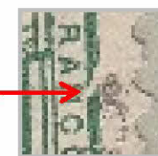
80a.7.6.18: Forte brisure oblique à droite près du «N» (D6) DR: 7