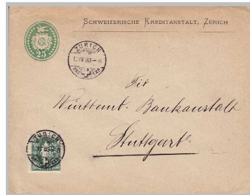
Tüblibrief 25cts de Zurich pour Stuttgart (Allemagne) affranchie à 25 cts (67Aa). Le timbre est perforé (Perfin) avec les lettres «scs» (S31, Société Crédit Suisse, Zurich, utilisé de 1874 à 1893)

Bloc de 10 (104), bloc de 4 (104), paire 103, bloc de 6 (95Bb)