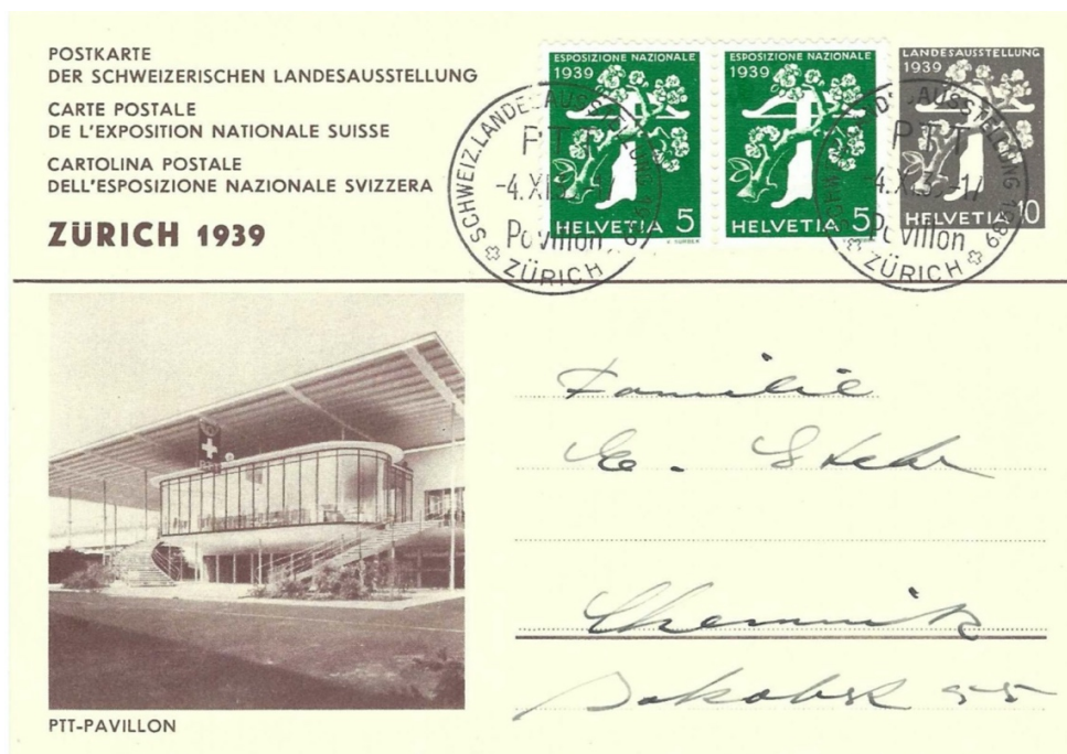
Postkarte 145b, 2. Serie Nr. 028 Portogerechte Auslandfrankatur mit Stempeldatum vom 4.XI.39! (Ausstellung beendet und geschlossen)

MITTEILUNGSBLATT DES SCHWEIZERISCHEN GANZSACHEN-SAMMLER-VEREINS ORGANE DE LA SOCIETE SUISSE DES COLLECTIONNEURS D'ENTIERS POSTAUX