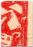
Rahmenbruch rechts auf der Höhe der Briefe