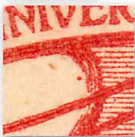
Farbpunkt in der Wolke unter dem VE von UNIVERSELLE

Die Abgangsstempel können auch bestimmt werden (Bern BRF. ⚡ EXP., Güller-Nr. 11209 aus August 1896).