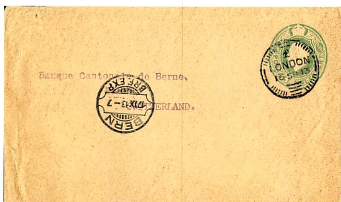
Abb. 10: Ankunftsstempel Bern 4.04 vom 17.9.1913

Beim ersten Beleg (Abb. 9) handelt es sich um eine Ganzsache mit Abgang von Thun per Bahn nach Bern. Der Ankunftsstempel erlaubt die Vorverlegung des Datums um einen Tag, vom 25.2.08 auf den 24.2.1908 (Frühdatum). Die Abbildung 10 zeigt eine Ganzsache aus England mit Abgang von London nach Bern. Das Datum vom 17.9.13 entspricht einem neuen Ankunfts-Spätdatum.