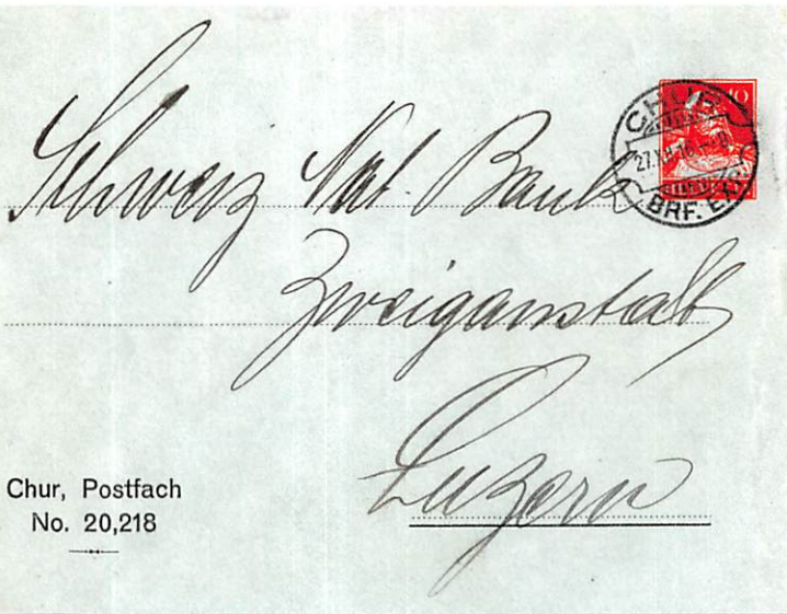
Abb. 14: Ganzsache von Chur nach Luzern, 27.12.1916

Wie sie sehen, kann man auch an weniger teuren Stempelbelegen Freude haben. Die Hauptsache ist, etwas Neues zu finden.