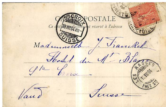
Abb. 2: Brief vom 18.8.04 nach Les Rasses

Beim nächsten Dokument (Abb. 2) handelt es sich um eine Postkarte aus Frankreich (? Seine et Oise) – leider ist der Abgangsstempel unleserlich – nach Les Rasses près de St-Croix gesandt wurde. Beim Stempel von St-Croix handelt es sich um einen Weiterleitungsstempel (0.04) mit dem Datum vom 18.8.1904.