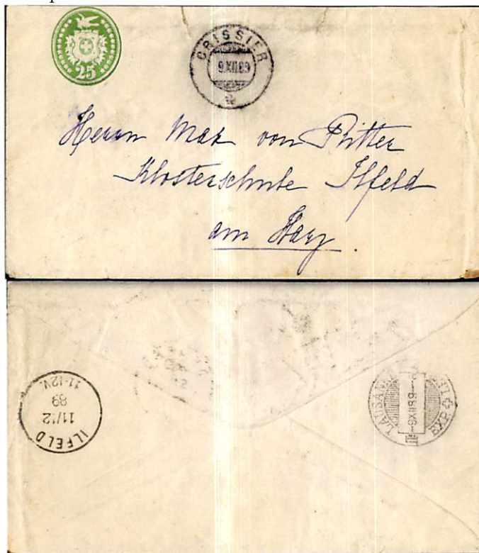
Abb. 1: Brief von Crissier nach Kloster Ifeld im Harz vom 9.12.1889, Vorder- und Rückseite

Stempel vom 9.12.1889. Wie Sie sehen können lohnt es sich wirklich, die Dokumente auch auf der anderen Seite zu prüfen.