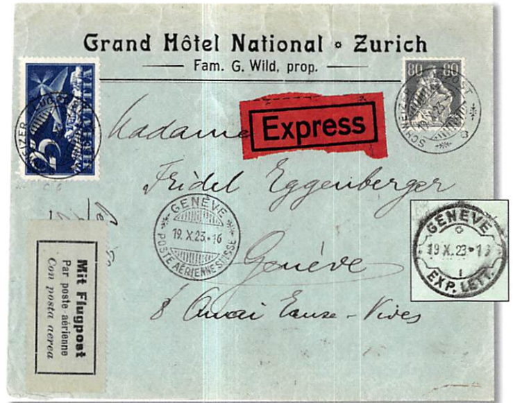
Abb. 16: Ankunftsstempel Genf 6.03 vom 19.10.1923

Bei den Genfer Stempeln sind bisher von der Nummer 6.03 keine Ankunfts-Daten bekannt. Es ist mir eine große Freude Ihnen zwei Dokumente vorzustellen.