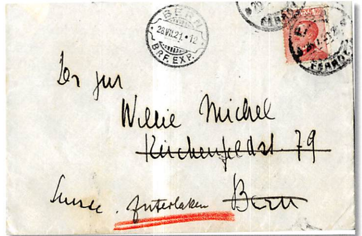
Abb. 7: Brief nach Bern, weitergeleitet nach Interlaken

Der Beleg (Abb. 7) wurde in Pisa (Italien) nach Bern aufgegeben, wo er nach Interlaken weitergeleitet wurde. Der Weiterleitungsstempel 4.03a datiert vom 28.7.1921, so dass das in der Masterliste belegte Datum somit um praktisch drei Monate vorverlegt werden kann.