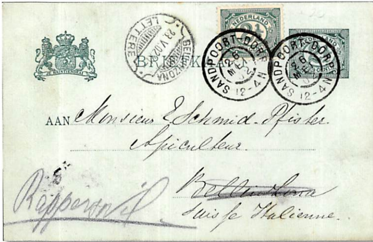
Abb. 5: Brief vom 26.5.1902 aus Sandpoort, Holland

Es handelt sich um eine Ganzsache mit Zusatzfrankatur von Sandpoort-Dorf (Niederlande) zunächst nach Bellinzona adressiert und dort nach Rapperswil weitergeleitet (Abb. 5). Das Datum vom 28.5.1902 ist das bisher einzig dokumentierte Datum.