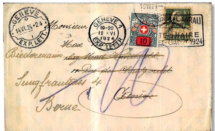
Abb. 17: Weiterleitung von Genf nach Bern 14.6.1924

Dieser Beleg wurde von Zürich nach Genf per Express und per Flugpost geschickt. Man kann nicht oft genug sagen: «Sehen Sie sich die Rückseite der Belege auch an». Hier ist der Beweis. Auf der Rückseite befindet sich der Genfer Ankunftsstempel 6.03 vom 19.10.1923. Einmalig.