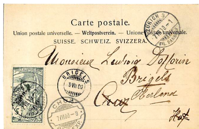
Abb. 12: Karte weitergeleitet nach Chur 7.7.1900

ich Ihnen gleich zwei Belege vorstellen, so dass Früh- und Spätdatum registriert werden können.