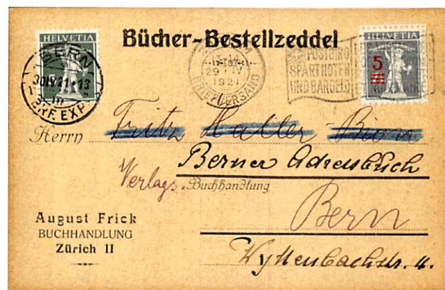
Abb. 11: Neu aufgegeben in Bern vom 30.9.1921

Auf der Masterliste ist die Rubrik Weiterleitungsstempel für die Nummer 5.01 leer. In der Folge werde