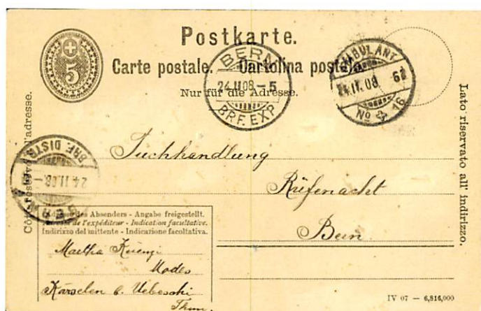
Abb. 9: Ganzsache von Thun nach Bern 24.2.1908

Beim ersten Beleg (Abb. 9) handelt es sich um eine Ganzsache mit Abgang von Thun per Bahn nach Bern. Der Ankunftsstempel erlaubt die Vorverlegung des Datums um einen Tag, vom 25.2.08 auf den 24.2.1908 (Frühdatum). Die Abbildung 10 zeigt eine Ganzsache aus England mit Abgang von London nach Bern. Das Datum vom 17.9.13 entspricht einem neuen Ankunfts-Spätdatum.