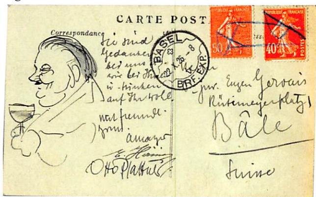
Abb. 3: Karte vom 22.10.1926 nach Basel

Wie Sie der Abbildung entnehmen können wurde die Postkarte von Frankreich nach Basel geschickt. Die Marken wurden mit zwei blauen Kreuzen entwertet und nebenan der Ankunftsstempel aufgesetzt mit dem Datum vom 22.10.26, nach Masterliste das bisher einzige Datum.