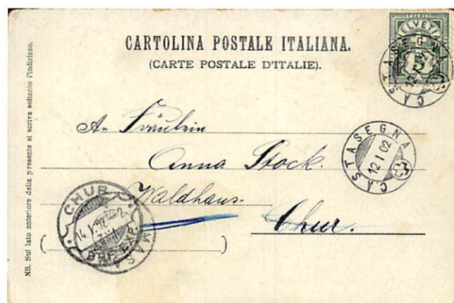
Abb. 13: Weiterleitung Chur - Masans, 14.1.1902

Der zweite Weiterleitungsbeleg (Abb. 13) datiert vom 14.1.1902. Die Postkarte wurde vom Castasegna nach Chur geschickt, um von dort nach Masans weitergeleitet zu werden.