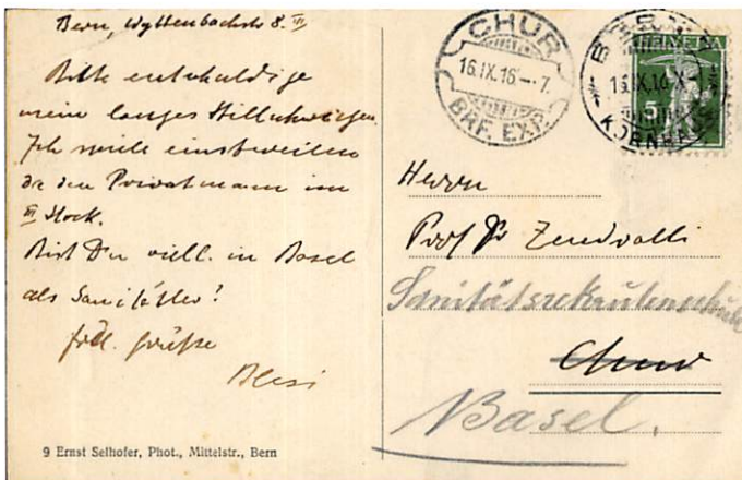
Abb. 15: Weiterleitung von Chur nach Basel, 16.9.1916

Bei der nächsten Postkarte (Abb. 15) handelt es sich um einen Weiterleitungsstempel. Wie Sie sehen können, wurde die Postkarte in Bern aufgegeben. In Chur wurde sie nach Basel weitergeleitet. Das Datum kann auf der Liste korrigiert werden und lautet nun: 16.9.1916.