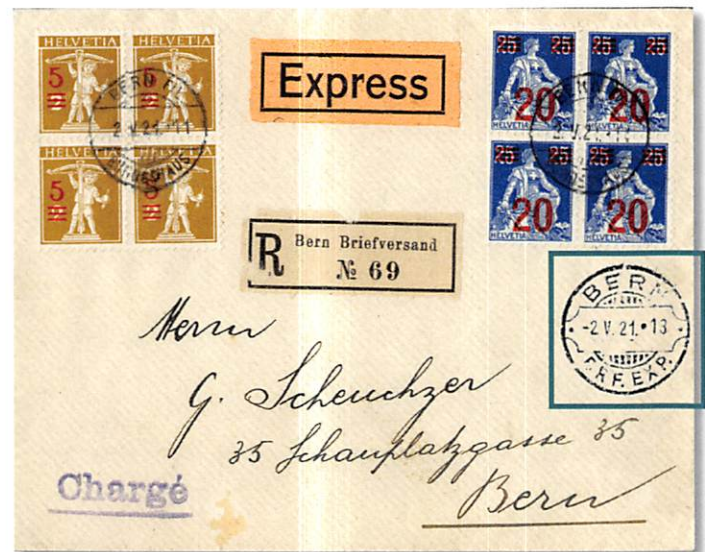
Abb. 8: Brief nach Bern, rückseitiger Ankunftsstempel

Der nächste Brief (Abb. 8) erlaubt die Korrektur des Ankunftsstempel sogar um ein Jahr und einen Monat vorzuverlegen. Es handelt sich um einen eingeschriebenen Express-Brief von Bern nach Bern, dessen Ankunftsstempel 4.03a auf der Rückseite das Datum vom 2.5.1921 trägt.