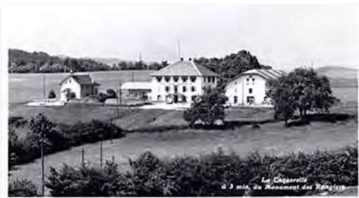
Carte postale illustrant « La Caquerelle »