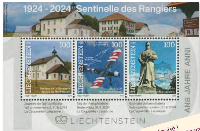
Bloc limité avec trois timbres d'entreprise Limitierter Block mit drei Firmenmarken

Déjà épuisé ! 2 e édition en préparation. Bereits ausverkauft! 2. Auflage in Vorbereitung.