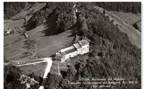
Vue aérienne du restaurant des Malettes

En grim pant au-dessus du brouillard tout en admirant les forêts rougeoyantes, nous sommes arrivés à la croisée des chemins, sur le col des Rangiers. Culminant à 800 mètres d'altitude, le gîte Les Malettes est ancré dans un décor féérique. Actuellement le bâtiment est un hébergement adapté pour les randonneurs, les familles et les groupes. Les Malettes (commune d'Asuel) est une ancienne station postale et relais sur l'embranchement des routes qui conduisent de Delémont à Saint-Ursanne et à Porrentruy. Le relais des Malettes est desservi par la diligence Porrentruy - Delémont du 1 er janvier 1857 au 31 décembre 1894. Les deux oblitérations du groupe 104 (« Fingerhut-Stempel ») de « Les Rangiers » (utilisé 20.3.1874 au 31.12.1879) et « Malettes » (utilisé du 19.5.1857 au 6.7.1873) ne sont pas très fréquentes.