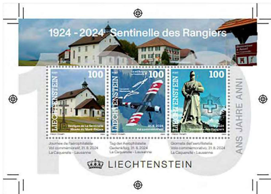
Epreuve du bloc du Liechtenstein Probedruck von Liechtenstein