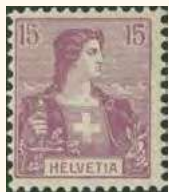
1907: SBK 106