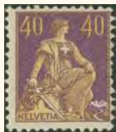
1908: SBK 107