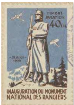
1924: Vignette «Les Rangiers»