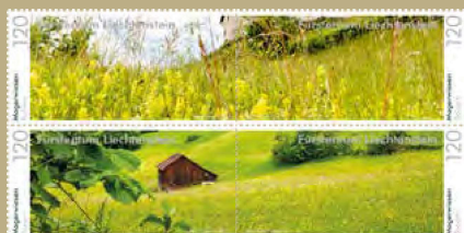
PANORAMA – MAGERWIESEN