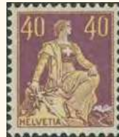
1908: SBK 112

Name Charles L'Eplattenier ausgeschrieben (völlig unleserlich); mit drei Lorbeerblättern versehen. Nom Charles L'Eplattenier écrit en toutes lettres (totalement illisible) et avec trois feuilles de laurier.