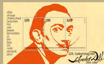
120. GEBURTSTAG VON SALVADOR DALI