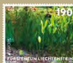
EUROPA – UNTERWASSERFAUNA UND -FLORA