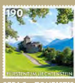
SEPAC – TOURISTISCHE HAUPTATTRAKTIONEN