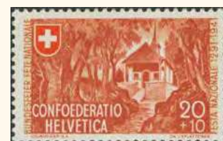
1941: PSBK B 14

L'Eplattenier gebeten, die Vignette für den aero- philatelistischen Flug im Jahr 1924 zu entwerfen. Das Ergebnis ist Ihnen sicher nicht unbekannt, es handelt sich um die Vignette mit «Le Fritz». Diese Vignette befindet sich auf den Briefen, die am 31. August 1924 von Delémont (und nicht wie ursprünglich geplant von La Caquerelle) nach Lau- sanne befördert wurden. Aus Sicherheitsgründen konnte das Flugzeug nicht in La Caquerelle landen und musste auf dem Flugplatz von Delsberg lan- den. Um diesen Künstler zu ehren, erinnere ich Sie an einige Schweizer Briefmarken, die von ihm ent- worfen wurden. ●