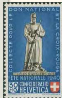
1940: SBK B 6 | 12