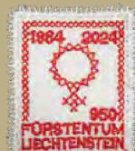
40 JAHRE FRAUENSTIMMRECHT IN FL