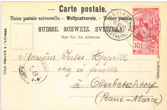
Carte postale de Mariastein pour Oberbetschdorf (Alsace) affranchie 10 cts (UPU 1900, 78A) timbre annulé par le cachet du groupe 149B (le cachet d'arrivée de Oberbetschdorf se trouve à gauche). Tarif du 1.7.1875 au 31.1.1921.