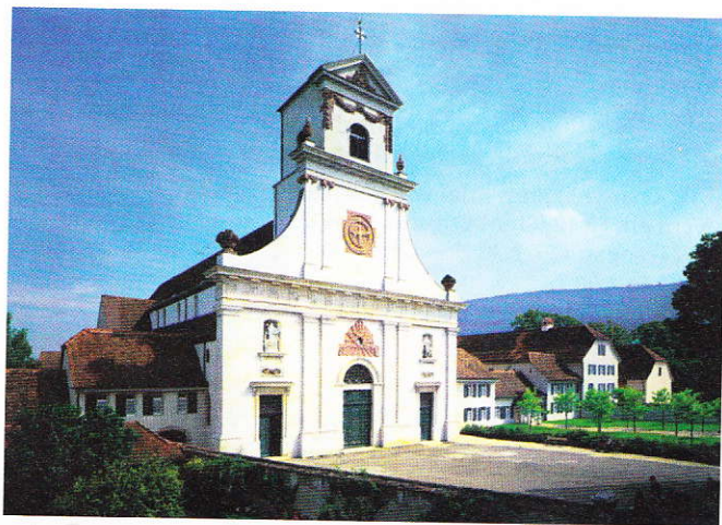
Eglise de l'abbaye. Die Kirche der Abtei.

Metzerlen-Mariastein ist eine Gemeinde im solothurnischen Bezirk Dorneck. Diese Gemeinde wird seit 2003 offiziell so genannt. Vorher hiess die Gemeinde Metzerlen. Mit mehr als 150 000 Besuchern pro Jahr ist Mariastein, nach Einsiedeln, der am häufigsten besuchte Wallfahrtsort der Schweiz.