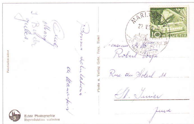
Carte postale de Mariastein pour St-Imier affranchie 10 cts (Zumstein 299). Cachet: K211. Tarif du 1.1.1921 au 31.10.1967.