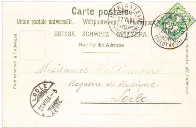
Carte postale de Mariastein pour Le Locle affranchie 5 cts. (65B). Tarif du 1.10.1870 au 31.1.1917.