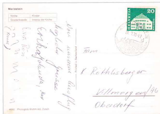
Postkarte von Mariastein nach Villmergen/AG mit 20 Rp. frankiert (Zumstein 415). Stempel: K211a. Tarif vom 1.1.1921 bis 31.10.1967.