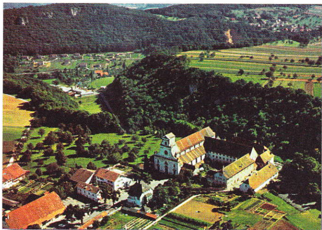
Carte postale avec la vue d'ensemble du monastère.

En 1941, la Gestapo fit main basse sur le monastère et renvoya les Suisses dans leur patrie. Le gouvernement soleurois autorisa les moines ainsi chassés à chercher asile à Mariastein. La propriété de Bregenz leur fut restituée après la guerre, mais ils n'envisagèrent pas d'y retourner. En 1953, le Grand Conseil soleurois discuta pour la première fois de la réouverture de Mariastein. Une expertise juridique de 1964, concluant qu'il n'y avait pas de violation de l'article 52 de la Constitution, prépara le terrain à un revirement: une loi (acceptée par le peuple et le Parlement en 1970) rendit en effet à l'abbaye son statut de collectivité indépendante, ainsi que ses bâtiments. Les moines renoncèrent aux anciennes propriétés conventuelles moyennant un dédommagement. La réinstallation eut lieu en 1971, les locaux furent restaurés de 1972 à 1989 (hormis la basilique rénovée en style néobaroque de 1899 à 1934). En 1981, la crise des vocations (56 religieux en 1960, 40 en 1980, 28 en 2000) poussa l'abbaye à abandonner la direction du collège d'Altdorf, dont les