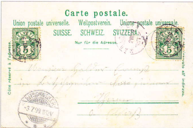
Carte postale de Mariastein pour Bitschweiler (Alsace) affranchie 10 cts (2 x 65B) timbre annulés par le cachet du groupe 145. Tarif pour les cartes postales du 1.7.1875 au 31.1.1921.

Postkarte von Mariastein nach Bitschweiler (Elsass) mit 10 Rp. frankiert (2 x 65B), beide Marken mit dem Stempel der Gruppe 145 entwertet. Postkartentarif vom 1.7.1875 bis 31.1.1921.