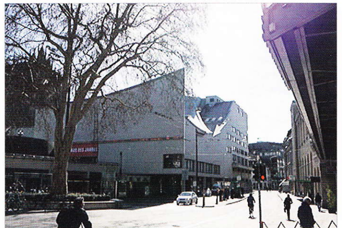
Fig. 4. Das Stadttheater heute an der Theaterstrasse. Le théâtre aujourd'hui à la Theaterstrasse

Le bâtiment fut totalement détruit par le feu le 7 octobre 1904 vers 2 heures. Ne restèrent debout que les quatre murs extérieurs. Le théâtre fut reconstruit par la suite par l'architecte Fritz Stehlin von Bavier et rouvert le 20 septembre 1909 avec l'opéra «Tannhäuser» de Wagner.