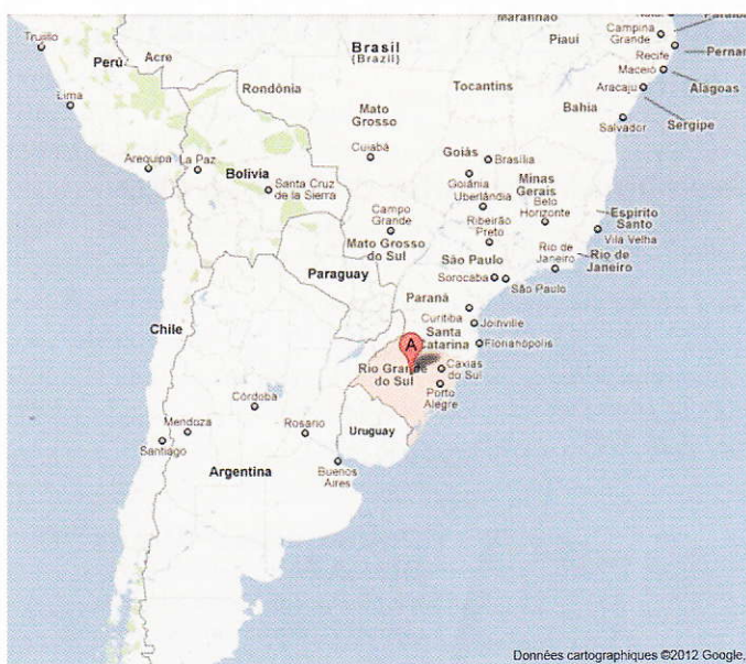
Fig. 1. Karte von Brasilien. Carte du Brésil.

Ce premier bâtiment, construit de 1830 à 1831, est l'œuvre de l'architecte néo-classique Melchior Berri. Il avait une capacité de 1300 places, taille considérable pour l'époque, alors que la ville de Bâle ne comptait encore que 24 000 habitants. En 1834