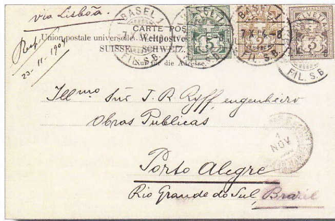
Fig. 2 und 2a: Vorder- und Rückseite der obengenannten Postkarte. Recto et verso de la carte postale mentionnée ci-dessus.