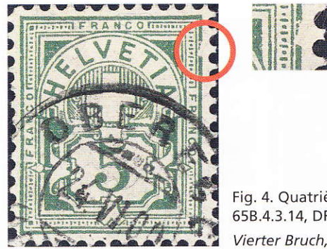
Fig. 4. Quatrième cassure, 65B.4.3.14, DR 1. Vierter Bruch, 65B.4.3.14, DR 1.

Le plaisir le plus grand pour un philatéliste est de trouver ces cassures sur des documents. La carte postale (Fig. 5) présente la première cassure (65B.4.3.2, DR 6).