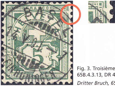
Fig. 3. Troisième cassure, 65B.4.3.13, DR 4. Dritter Bruch, 65B.4.3.13, DR 4.