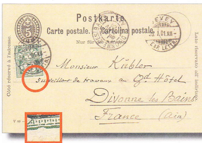
Fig. 10. Carte postale de Vevey pour Divonne-Les-Bains affranchie à 10 cts (PK 26, 65B.4.3.24, DR: 6); tarif pour les cartes postales pour l'étranger du 1.7.1875 au 31.1.1921.

Brief von Langnau nach Langnau mit 5 Rp. frankiert (82.7.6.15, DR: 8); Lokalrayontarif vom 1.1.1891 bis 31.12.1917 bis 250 g).