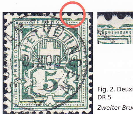
Fig. 2. Deuxième cassure, 65B.4.3.6, DR 5