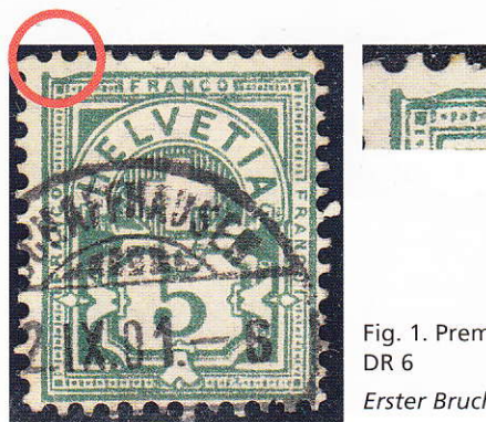
Fig. 1. Première cassure, 65B.4.3.2, DR 6

Die ersten vier Rahmenbrüche stammen aus der vierten Ausgabe (dritte Stempelnachprägung, 1899–1902). Der erste Bruch befindet sich oben links (A6) mit einer abgerundeten Ecke rechts oben (A6), DR 6. Beim zweiten Bruch handelt es sich um einen starken Einbruch oben rechts (A5-6), DR 5. Der dritte Bruch befindet sich am Rahmen rechts oben und betrifft beide Rahmen (A6), DR 4. Der vierte und letzte Bruch dieser Ausgabe ist ein dreieckiger Rahmenbruch rechts oben (AB6), DR 1.