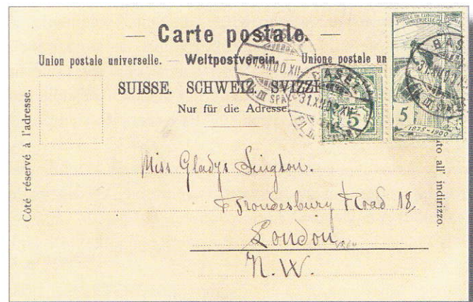
Fig. 6. Carte postale de Bâle pour Londres affranchie à 10 cts (77C, 65B.4.3.13, DR: 4; tarif pour les cartes postales du 1.7.1875 au 31.1.1921).

Vous pouvez constater que les cassures et les brisures du cadre extérieur ne sont pas si rares et il n'y a pas que six cassures comme mentionné dans le catalogue spécial Zumstein.