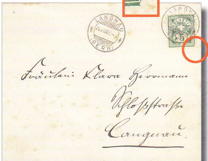
Fig. 8. Lettre de Langnau pour Langnau affranchie à 5 cts (82.7.6.15, DR: 8); tarif pour le rayon local du 1.12.1891 au 31.12.1917, jusqu'à 250 g.

Brief von Langnau nach Langnau mit 5 Rp. frankiert (82.7.6.15, DR: 8); Lokalrayontarif vom 1.1.1891 bis 31.12.1917 bis 250 g).