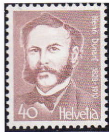
Série de portraits de 1978, Zumstein 618