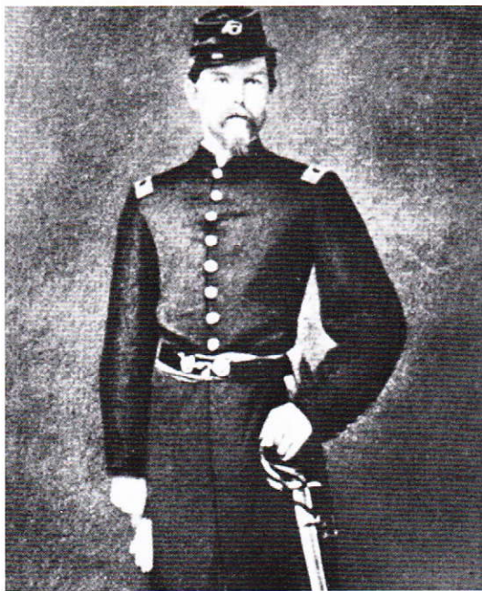
Emil Frey en tant que Major dans l'uniforme du 82ème régiment d'infanterie de l'Illinois

Après son retour des Etats-Unis il commença sa carrière politique comme membre du Gouvernement du demi-canton de Bâle-Campagne de 1865 jusqu'en 1872. Après avoir refusé un nouveau mandat cette année-là, il fut élu au Conseil national. Il fut président du Conseil national en 1876. En parallèle, il travailla