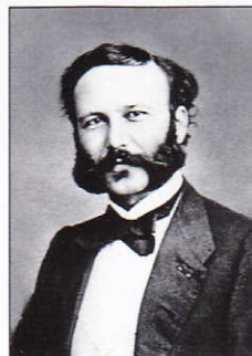
Henri Dunant vers 1860

Il s'agit ni plus ni moins du fondateur de la Croix-Rouge! Henri Dunant est né le 8 mai 1828 à Genève sous le nom de Jean-Henri Dunant. C'était un homme d'affaires qui se trouva lors d'un voyage d'affaires en 1859 tout près d'une bataille à Solferino en Italie. Il découvrit ainsi les atrocités de la