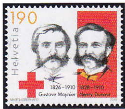
Timbre spécial de 2010 pour le centenaire de la mort d'Henry Dunant et de Gustave Moynier, Zumstein 1358

ratifiée en 1864 et se référa largement aux propositions d'Henri Dunant.