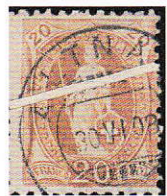
16) Plis à l'impression ou plis accordéon; 94Ab

Nous nous rendons rapidement compte que collectionner des timbres, des oblitérations, des nuances de couleurs et des variétés c'est très passionnant, mais à la base, d'où viennent tous ces timbres? Ils étaient collés sur des lettres! Tout ce courrier, comment a-t-il voyagé à cette époque-là? Il n'y avait pas les moyens de transport que nous avons de nos jours et il n'y avait surtout pas d'E-MAIL. Nous rentrons dans le domaine des genres de courrier (envoi de lettres, de cartes postales, d'imprimés, de recommandés, de remboursements etc.), des tarifs et des destinations.