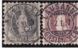
3) 69B et 71Db avec une oblitération centrale

Ne vous contentez pas d'oblitérations de deuxième choix. Vous aurez toujours plus de plaisir à revoir et montrer votre collection avec des pièces d'exception (Illustration 3).