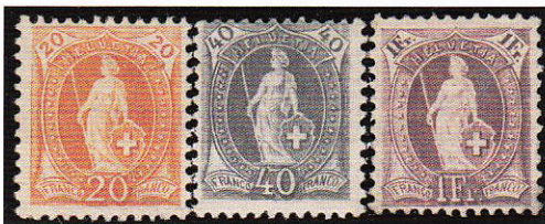
1) 66Ca, 69Ca et 71Ca

L'émission de l'Helvetia debout connut différentes séries. Les premières trois séries furent imprimées sur papier blanc avec une marque de contrôle large (MC I). Ces trois séries se distinguèrent par leur dentelure, la première ayant 14 dents, la deuxième 11 dents et la troisième 13 dents. (Illustration 1)