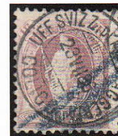
11) 71Ab Oblitération Colico Uff. Svizz. Di Messaggeria

Le sujet qui suivra mérite une attention particulière, il s'agit des variétés. Certes, il faut aimer les détails et la recherche des «chieurs de mouches» qui permettent malgré tout aux spécialistes de reconstruire des planches d'impression. Malheureusement, seules les variétés très marquées sont d'intérêt lors d'une exposition. Afin d'essayer de passionner le lecteur pour cette