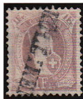
5) 71Aa Oblitération-Kölliken (AG)

En triant les timbres afin de trouver une oblitération de premier choix nous nous rendons vite compte qu'il faut trier un certain nombre de timbres afin de trouver ce qui correspond à nos attentes. Parmi toutes ces oblitérations il y en a de très fréquentes et des oblitérations plus rares sur cette émission.