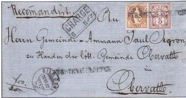
6) Lettre recommandée de FÜRSTENAUERBRUCK pour Obervatz (Rayon local) avec une Helvetia debout 20cts (66Aa.2.29/1, 1er état) et avec un type chiffre et croix (54a, papier blanc). Les timbres sont oblitérés par un cachet linéaire du groupe 30.