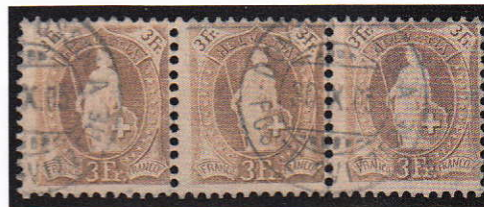
10) 70Dc Oblitéré Domodossola Poste Svizzera

Nous avons donc survolé les oblitérations sur les Helvetia debout. Un autre sujet passionnant de cette émission consiste à collectionner les nuances de couleurs. Nous remarquerons rapidement que ce n'est pas toujours facile de différencier les nuances car il existe des nuances dans les nuances. Nous vous présenterons trois nuances qui sont relativement difficiles à trouver. Il s'agit du 66Ad (orange-rouge; Illustration 13), le 71Ad (lilas-brun-clair/lilas-brun; Illustration 14) et le 86Ad (orange clair; Illustration 15), une nuance très rare, seuls trois exemplaires sont répertoriés jusqu'à présent.