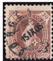
20) HELVETTA, 68De.2.50/II, case 125/IIa

Le courrier pour l'étranger est fascinant. C'était une époque avec beaucoup de changements et, pour l'Europe, une époque agitée par des conflits et des guerres. Néanmoins, le courrier arrivait à destination.