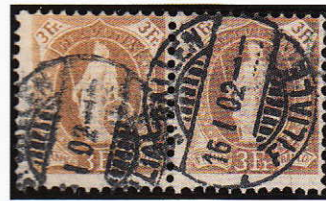
4) Paire du 72Fa (case 99 et 100 de la planche d'impression Ia). Seules trois paires sont connues jusqu'à présent.

Mentionnons à cette place les six dentelures peu fréquentes, que possèdent le 68A, le 72C, le 72F (Illustration 4), le 100A, le 97B et le 99B.