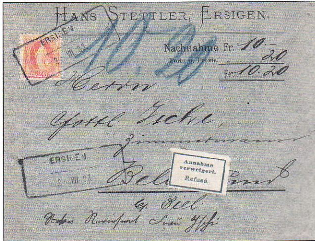
7) Remboursement affranchi à 20 cts avec un cachet de remplacement de Ersigen

Les deux prochains groupes d'oblitérations sont eux aussi très recherchés car ils sont rares sur l'émission d'Helvetia debout.