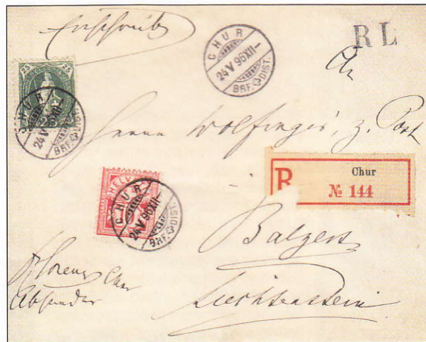
23) Lettre recommandée de Coire pour Balzers (Liechtenstein); rayon limitrophe