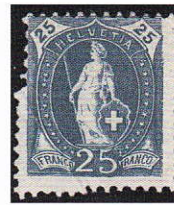
17) Plis à la perforation; 73D

Parmi les affranchissements pour la Suisse il y a une lettre qui est très recherchée. Il s'agit des lettres du 2ème échelon de poids pendant la période du 1.9.1876 au 31.10.1884, donc avec les Helvetia debout seulement possible à partir du 1.4.1882, soit 30 mois (illustration 21).