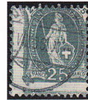
18) Dentelure fortement décalée; 67Da

Les utilisations tardives de l'émission Helvetia debout sont toujours très jolies et peu fréquentes car utilisées en affranchissement mixte. La lettre suivante se démarque des autres pour plusieurs raisons: premièrement, c'est une utilisation tardive (nous rappelons que les Helvetia debout pouvaient être utilisées jusqu'au 31.12.1924); deuxièmement, il s'agit d'un affranchissement mixte et troisièmement, c'est un envoi «Express». Le tarif se compose comme suit: 10cts pour l'envoi d'une lettre jusqu'à 250 g. (tarif du 1.1.1912 au 31.06.1925) et 60 cts pour l'envoi Express (tarif du 1.1.1912 au 28.2.1934). Cela devait vraiment être très urgent pour payer sept fois plus que d'habitude (illustration 22).