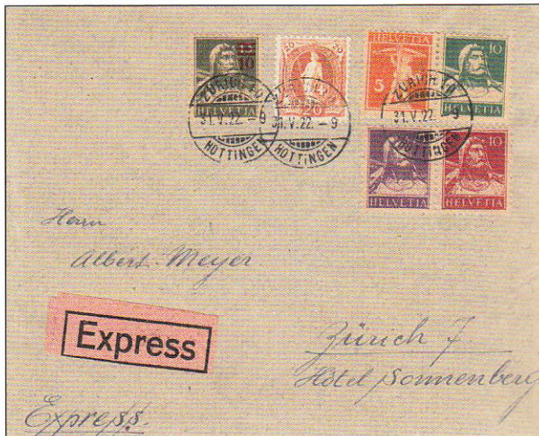
22) Lettre Express de Zurich pour Zurich affranchie à 70cts (86Ca, 149, Z1, Z4).

La lettre de Coire pour Balzers (rayon limitrophe; illustration 23) fait partie de nos lettres préférées. A savoir que la Principauté de Liechtenstein n'avait pas encore signé la convention sur la monnaie avec la Suisse (convention signée en 1921 seulement).