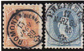
8) Groupe d'oblitération 104 et 115

Il s'agit du groupe 104 (dit «dé à coudre» ou «Fingerhutstempel») (Illustration 8) que nous trouvons sur une 66B (Oblitération Romont s/Bienne) et du groupe 115 sur une 70Aa (Oblitération Rheineck /ZH). Le groupe 104 est un groupe intéressant et recherché par les collectionneurs de cachets. Rien qu'avec ce groupe vous pouvez monter une collection d'exception. Ainsi avec le groupe 138, les cachets nains («Zwergstempel»).