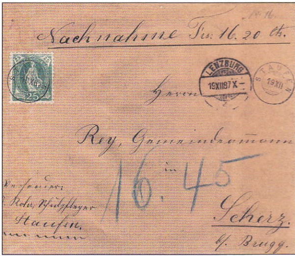
9) Remboursement de Staufen pour Schertz oblitéré par un cachet du groupe 138

Parmi les affranchissements pour la Suisse il y a une lettre qui est très recherchée. Il s'agit des lettres du 2ème échelon de poids pendant la période du 1.9.1876 au 31.10.1884, donc avec les Helvetia debout seulement possible à partir du 1.4.1882, soit 30 mois (illustration 21).