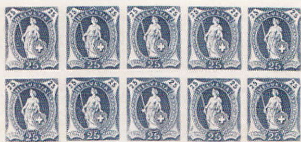
Bloc de dix d'une épreuve de couleur d'une planche non acceptée. Il s'agit des cases 81 à 95 d'une planche de 100 timbres.

Avec la prochaine pièce, nous vous présentons un ensemble de cinq bandes verticales de trois exemplaires de 20, 25, 40, 50 cts et 1 franc, non dentelées dans les couleurs finalement adoptées. Ces bandes sont collées sur une feuille de papier. Parmi ces cinq bandes, les 20, 25 et 40 cts sont munis du filigrane ovale de forme large. Le 50 cts et le 1 franc sont sans filigrane. Cette pièce proviendrait d'un directeur général des PTT qui avait rangé les archives (pour enjoliver le mot voler).