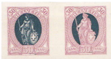
ES 68.3.01 q @ r

Avec les trois pièces suivantes, nous vous présentons des essais d'impression.