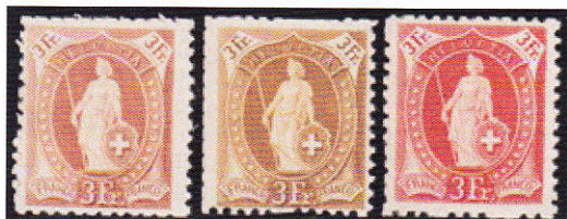
Cinq épreuves de couleur dentelées

Il existe aussi des épreuves d'oblitération . Ces oblitérations sont apposées sur des épreuves sur papier originale ou non, afin de contrôler l'aspect ou la sécurité de l'encre.