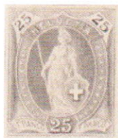
Gris non répertorié

Les premières épreuves sont donc imprimées en 1881 en taille-douce sur du carton blanc, mais sans les cartouches supérieures. Dans la même année, le dessin subit une modification, les cartouches sont maintenant dans les angles supérieurs. Ces épreuves existent en différentes couleurs.