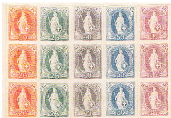
PD 66.4.01a - PD 67.4.01a - PD 69.4.01a - PD 70.4.03a - PD 71.4.03a

Avec la prochaine pièce, nous vous présentons un ensemble de cinq bandes verticales de trois exemplaires de 20, 25, 40, 50 cts et 1 franc, non dentelées dans les couleurs finalement adoptées. Ces bandes sont collées sur une feuille de papier. Parmi ces cinq bandes, les 20, 25 et 40 cts sont munis du filigrane ovale de forme large. Le 50 cts et le 1 franc sont sans filigrane. Cette pièce proviendrait d'un directeur général des PTT qui avait rangé les archives (pour enjoliver le mot voler).