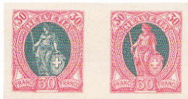
ES 68.3.01 m @ n

Les trois prochaines pièces sont des «Libertas» de provenance privée, donc sans aucune valeur philatélique. Nous les trouverons, en masse, dentelées, non dentelées, de toutes les couleurs et sur toutes sortes de papier imaginables.