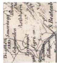
PD 71.4.02a verso