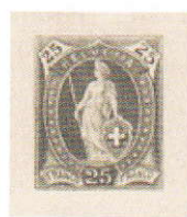
Gris non répertorié