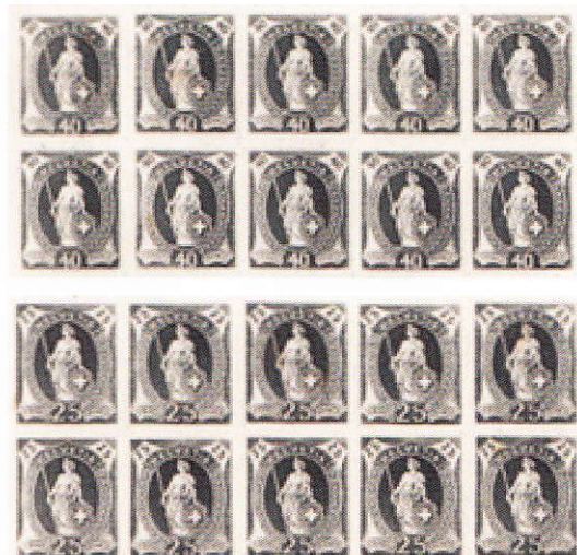
Extraits de planches inachevées de Max Girardet

Les réimpressions de Paris se laissent «plancher» à l'aide de la pièce ci-dessus en noir. Ceci facilite l'identification de ces pièces qui sont, rappelons-le, sans valeur philatélique.