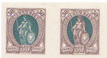
ES 68.3.01 o @ p