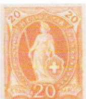
PD 66.4.01a recto et verso

Afin de tester et comparer la couleur qui sera finalement adoptée pour le timbre qui sera vendu aux guichets, des épreuves de couleur sont réalisées.