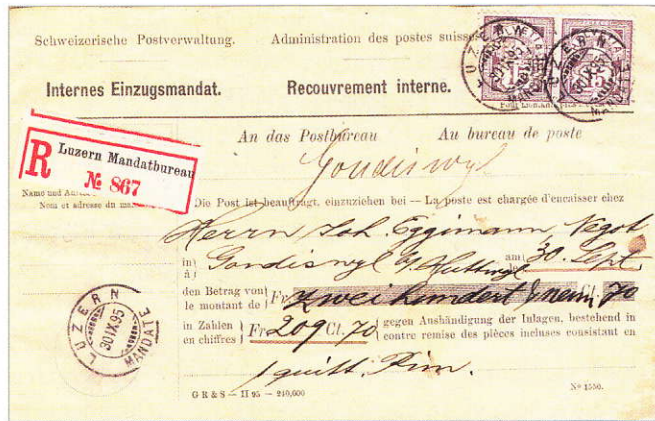
Recouvrement interne. Internes Einzugsmandat.

internet. Mais internet n'offre pas le plaisir de l'échange avec le marchand pour discuter du document et négocier le prix.