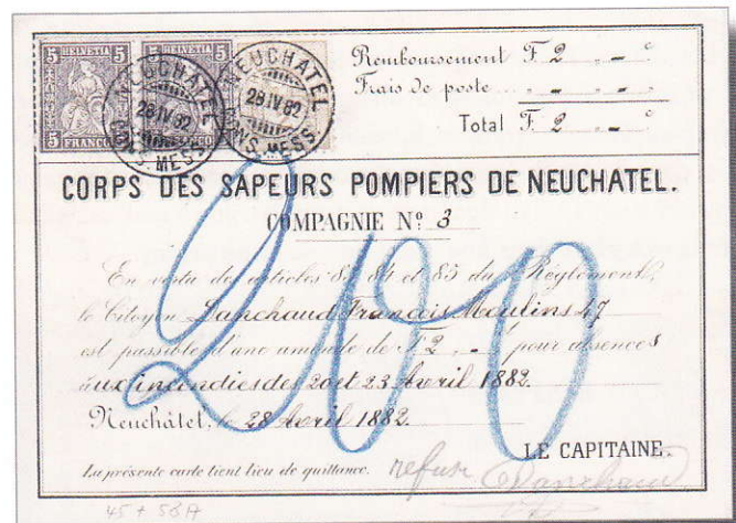
Remboursement avec affranchissement mixte.

Der Postbeamte hat vermutlich seine letzten sitzenden Helvetia à 2 Rappen aufgebraucht und mit der Benutzung der neuen Ausgabe begonnen, die am 1. April 1882 ihren vierzigjährigen Dienst angetreten hat (Gültigkeit bis am 31.12.1924).