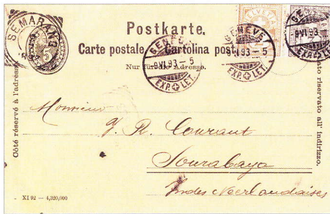
Entier postal avec affranchissement complémentaire pour Sourabaya. Ganzsache mit Zusatzfrankatur nach Surabaya.

Les deux cartes postales suivantes se caractérisent par leurs destinations. La première est un entier postal, qui débuta son voyage à Genève, transita à Semarang pour arriver à Sourabaya dans l'actuelle Indonésie. Le degré de rareté selon Schäfer s'élève à 9 sur 13. Un document à première vue banal, mais qui mérite une place dans une collection de destinations.