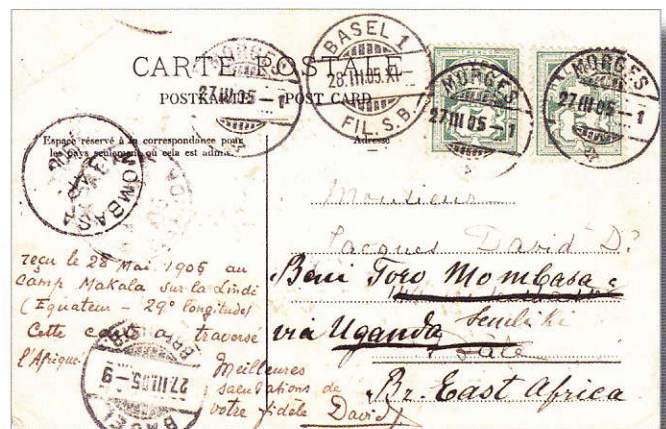
Destination Mombasa, Afrique Orientale Anglaise. Destination Mombasa, British-Ostafrika.

Die zweite Postkarte (unten) zeichnet sich durch ihre Destination und ihren Leitweg aus. Nach Abgang von Morges (Abgangsstempel: Morges 27 III 05-1) kommt sie zunächst in Basel (Ankunftsstempel: Basel 27 III 05-9) an. In Basel wurde die Karte weitergeleitet (Weiterleitungsstempel: Basel 28 III 05.XI) via Uganda (Transitstempel: Kampala ... April 05) nach Mombasa (Ankunftsstempel: Mombasa 13 AP. 1905). Mombasa war von 1898 bis 1905 die Hauptstadt von Britisch-Ostafrika, dem heutigen Kenya, das im Jahre 1920 seine Unabhängigkeit erlangte. Diese Destination erlangt bei Schäfer die höchste Seltenheitspunktzahl (13) und ist zudem ein postgeschichtlich interessantes Dokument.