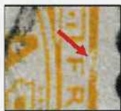
Fig. 2. Vergrößerung des Plattenfehlers

Par la suite, nous avons encore trouvé un troisième défaut de cliché sur un 63 Aa. Il s'agit de la brisure de l'ornement de droite (E5) que nous reproduisons ci-dessous [ill. 5 et 6]. Un tel défaut peu facilement passé inaperçu, surtout si celui-ci se trouvait sur un timbre de nuance claire, par exemple sur un 63 Ab.