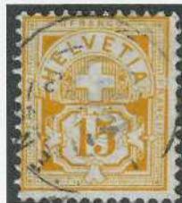
Fig. 3. 57b Stadium 1

In unserem ersten Artikel haben wir einen Bruch im Rahmen auf der rechten Seite neben dem «F» von «FRANCO» (C6-7) auf einer 57b gezeigt (Abb. 1 und 2). Wir haben eine weitere 57b mit quasi demselben Defekt, aber in einem früheren Stadium, entdeckt. Der Bruch ist nicht so ausgeprägt wie auf der ersten 57b. Wie so viele Defekte in dieser Ausgabe werde die Brüche immer grösser. Das Messing-Cliché, ein weiches Metall, nützt sich mit der Zeit ab (Abb. 3 und 4).