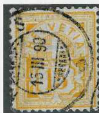
Fig. 5. 63Aa

Par la suite, nous avons encore trouvé un troisième défaut de cliché sur un 63 Aa. Il s'agit de la brisure de l'ornement de droite (E5) que nous reproduisons ci-dessous [ill. 5 et 6]. Un tel défaut peu facilement passé inaperçu, surtout si celui-ci se trouvait sur un timbre de nuance claire, par exemple sur un 63 Ab.