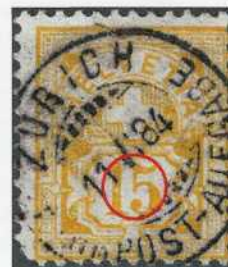
Fig. 7. 63Aa

Eine weitere Marke zeigt einen weissen Punkt auf der Ziffer 1 sowie auf der Ziffer 5 (Abb. 7 und 8). Diese zwei weissen Punkte gleichen der Abart der 5 Rp., 65B auf der 7. Ausgabe, 6. Nachprägung, Nummer 52 nach der Beschreibung von Herrn Raymond Roux (JPhS/SBZ 6 und 7/1987, p. 161). Diese Arbeit ist auf der Webseite des Club philatélique de Delémont et environs ( www.cpde.ch ) für alle einsehbar.