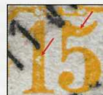
Fig. 8. Vergrößerung des Plattenfehlers