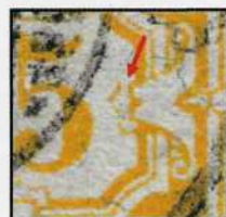
Fig. 6. Vergrößerung des Plattenfehlers

Un autre timbre qui nous a été soumis présente une tache blanche sur les chiffres 1 et une autre sur le 5 [ill. 7 et 8]. Ces deux taches ressemblent à celle qui affecte notamment le timbre de 5 cts, 65 B, 7 e émission et 6 e réestampage, variété n° 52, mentionnée par M. Raymond Roux (JPhS/SBZ 6/7/1987, page 161) dans son étude qui est accessible sur le site du Club philatélique de Delémont et environs: www.cpde.ch , que chacun peut imprimer ou télécharger gratuitement.