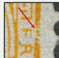
Fig. 4. Vergrößerung des Plattenfehlers

In der Folge haben wir eine dritte Abart auf einer 63Aa gefunden. Es handelt sich um einen Bruch am oberen Teil des Schenkels rechts (E5), den wir in den folgenden Abbildungen darstellen (Abb. 5 und 6). Solch ein Bruch kann leicht übersehen werden, wenn sich dieser auf einer hellen Farbnuance befindet, wie es der Fall wäre auf einer 63Ab.