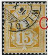
Fig. 1. 57b, Stadium 2

droit sur un 57b, à côté du F de FRANCO (C6-7) [ill. 1 et 2]. Aujourd'hui nous avons trouvé, sur un autre 57b, une cassure quasiment identique, mais dans un stade plus précoce. La cassure n'est pas encore aussi nette que sur le premier timbre. Comme bon nombre de ces défauts de clichés, ces cassures sont évolutives, le cliché en laiton, métal tendre, s'altérant en cours de tirage [ill. 3 et 4].